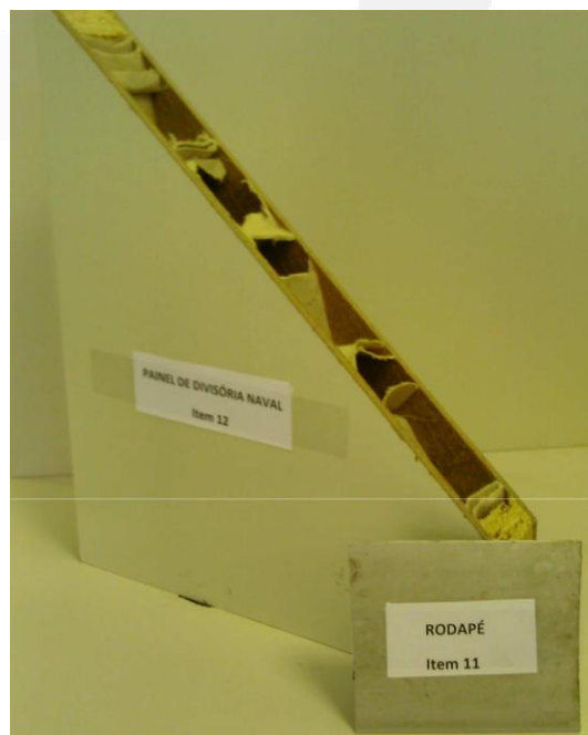
Detalhe dos itens 11 e 12